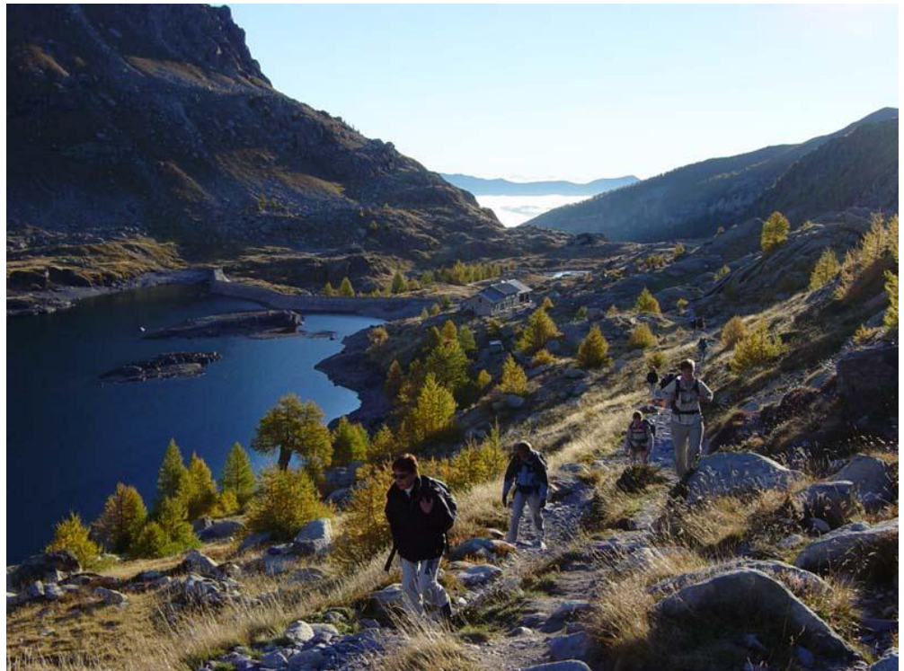
▲ Randonnée vallée des Merveilles ; Départ du refuge au lever du jour

Un programme est édité trois fois par an comprenant la liste des sorties, quelques indications importantes pour son organisation, ainsi que les coordonnées des animateurs, qui vous renseigneront volontiers sur leurs sorties.