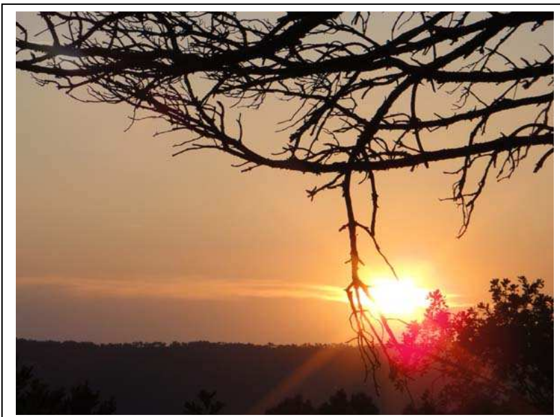
Un coucher de soleil sur le plateau de Valensole

Un peu avant 20 heures je commence mon repas avec une soupe aux champignons, des rillettes au saumon, des œufs au plat et des pâtes à la sauce tomate. Vers 8 heures 30 le vent tombe et la chaleur