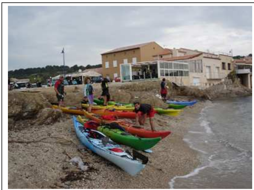
Le départ à la Tour Fondue