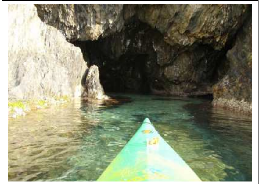
L'entrée d'une petite grotte avec une eau si claire...