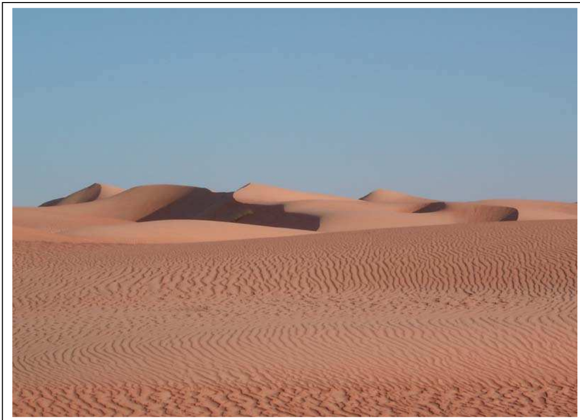
Photo 10 Paysage grandiose que ces dunes à perte de vue

Grâce à un petit livre d'astronomie que j'ai emporté, je découvre des nouvelles constellations que l'on ne voit pas ou difficilement chez nous.