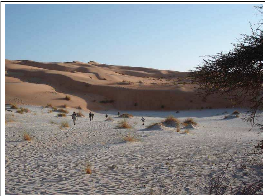
Photo 7 Parfois le sable des regs est blanc (bonux) et contraste avec le sable orange des dunes