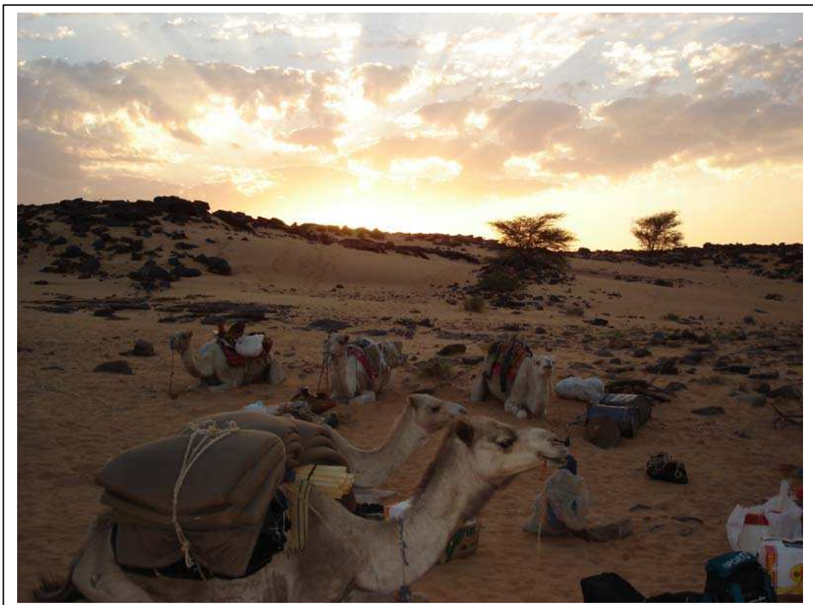
Photo 16 Lever de soleil et chameaux chargés pour partir

Un oued, c'est le lit d'une rivière à sec qui ne coule que par grosse pluie, généralement en août et septembre.