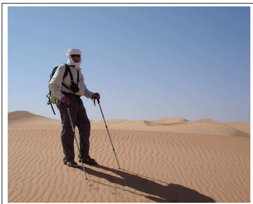
Photo 9 Parfois on rencontre même des bédouins en sandales.

Après ce petit en cas, il faut filtrer l'eau pour le lendemain. En moyenne, nous filtrons 3 à 4 litres par jour et par personne grâce à la petite pompe que j'ai eu la bonne idée d'acheter avant de partir... Mais hélas l'eau est si boueuse qu'il faut nettoyer le filtre tous les 2 litres traités. A ce régime, il ne tiendra pas jusqu'à la fin du trek. Bien sur, nous mettons aussi du « micropur » dans l'eau filtrée pour plus de sécurité.