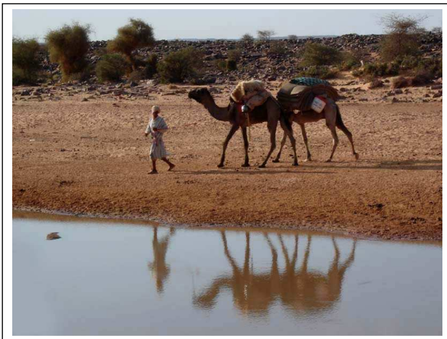
Photo 15 Les chameaux suiveurs devant un point d'eau