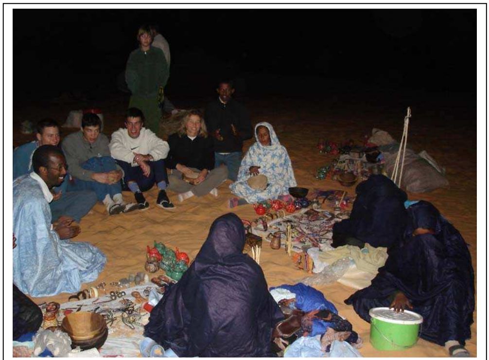
Photo 12 Soirée rires et chansons folkloriques improvisée en plein désert

Le lendemain, je me réveille vers 3 heures et contemple le ciel jusqu'à connaître toutes les étoiles et toutes les constellations visibles. Le matin, c'est celle du Lion que l'on voit le mieux. Vers 4 heures, une petite distraction, les chameliers qui partent à la recherche des chameaux, enfin des dromadaires vu qu'ils n'ont qu'une bosse... Il faut savoir que le soir, les chameaux sont lâchés en liberté, ils sont juste entravés sur les pattes avant et ne peuvent faire que des petits pas.