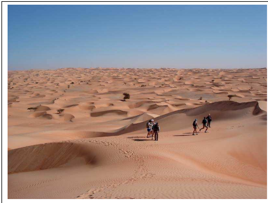
Photo 2. Vous vouliez du sable, servez-vous...