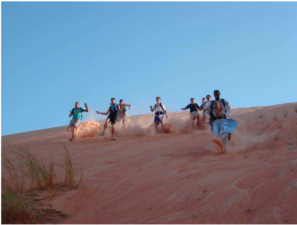
Photo 5 et 6 La meilleure façon de descendre les dunes, c'est en courant

Nous prenons notre petit déjeuner avec du thé, du café, du bon pain, de la confiture, du miel, du Nuttela et des « vache qui rit » et nous fermons nos gros sacs, afin qu'ils soient chargés sur le dos des chameaux... Vers 8 heures, nous prenons la direction du sud, tout droit vers le désert profond... Parfois le sable est dur et c'est relativement facile de marcher, parfois il est mou et cela devient plus difficile.