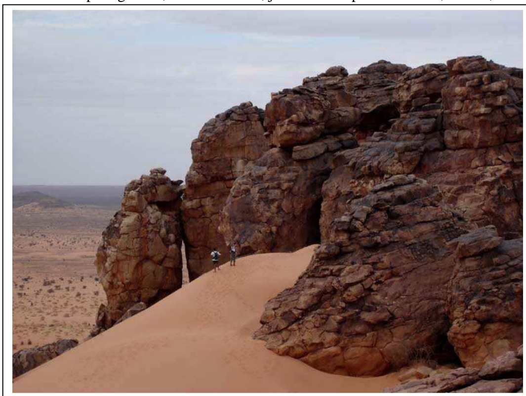
Photo 14 Les rochers de la Montagne de Zarga