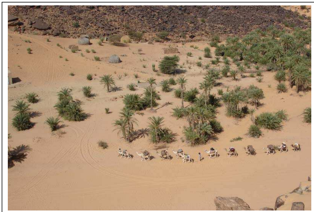
Photo 18 Notre caravane de chameaux dans l'oued de Mhairret