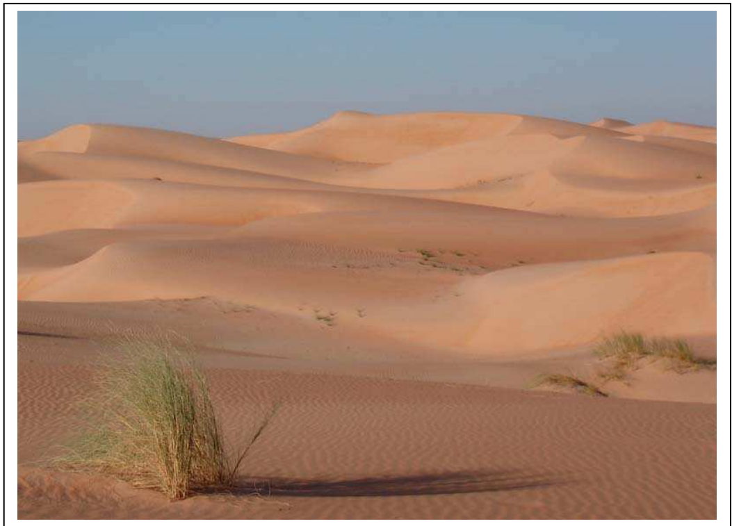
Photo 4 Parfois, le désert est vraiment désert