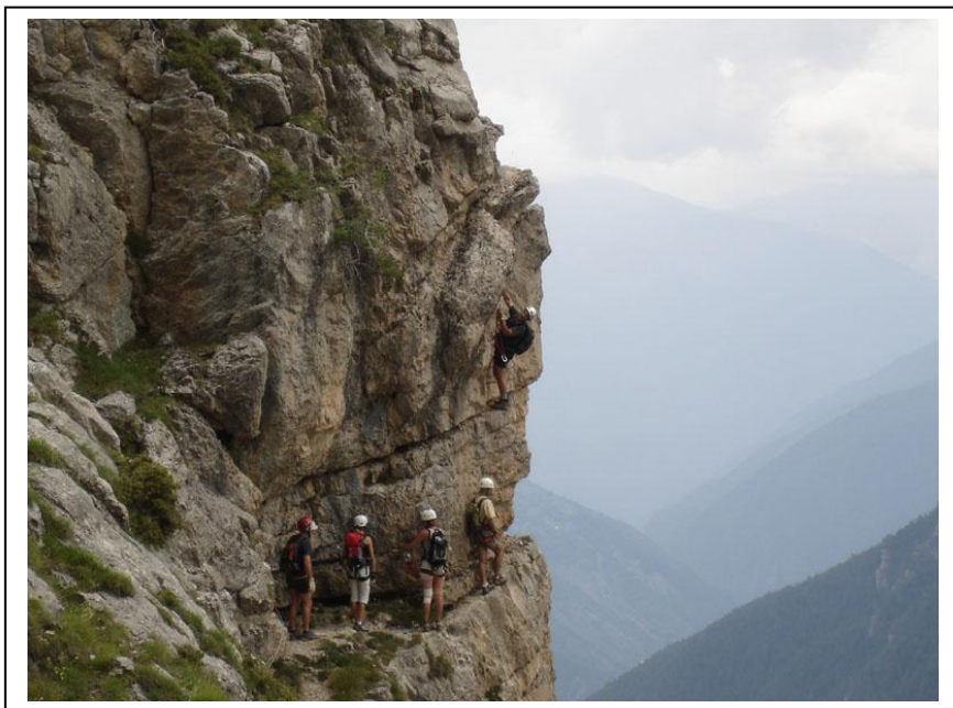
Le départ du 4ème tronçon