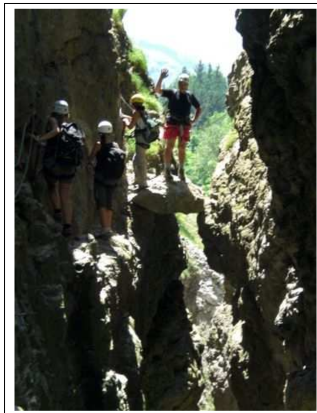
5 Nos 3 grâce et votre serviteur sur le bloc coincé