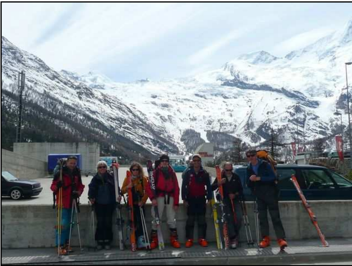
A Saas Fee, en route pour les 4000, qui nous narguent là haut !