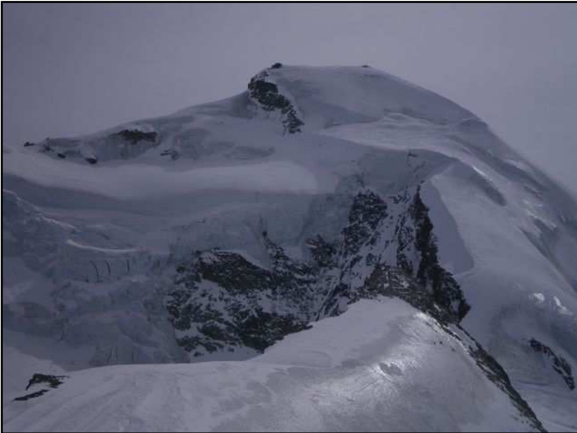
L'Alallinhorn 4030m du haut des pistes– Peu de neige, le vent ici aussi a soufflé !