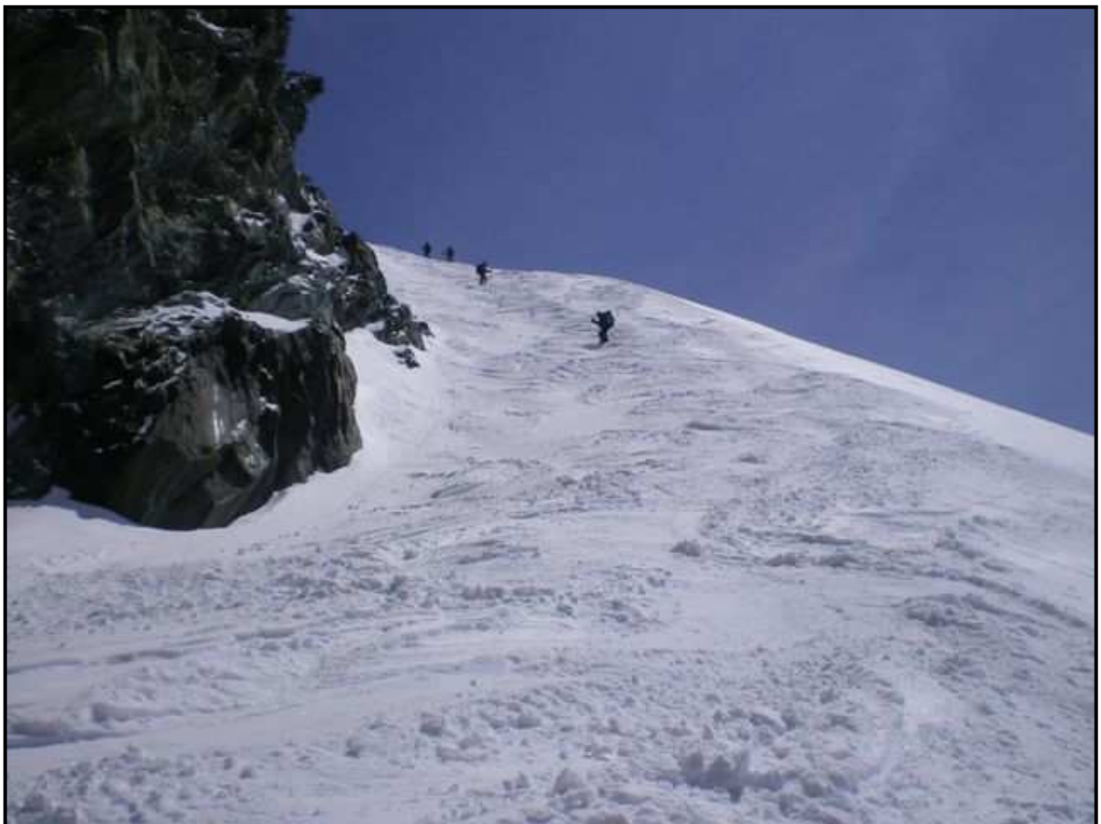
Descente du Strahlhorn : Le passage sous l'Adlerpass 3789m – Ca passe bien et raide