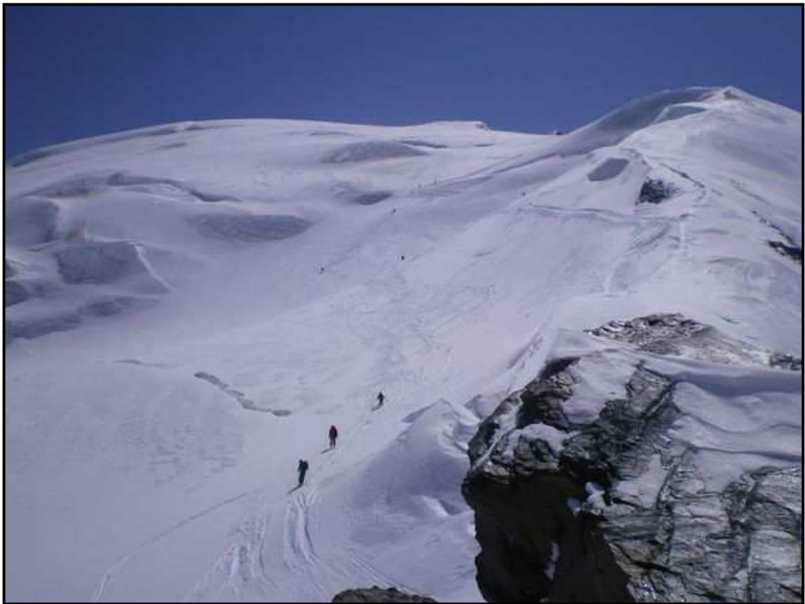
Descente du Strahlhorn : Le passage raide à 3900m Ne pas découper la glace selon le pointillé et ne pas musarder sur la crevasse