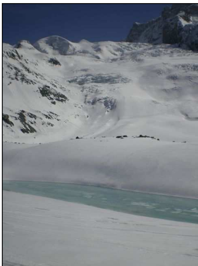
Descente finale sur 6 km du Gornergletscher, entre les piscines Au fond, le fameux hors piste de Schwarztor