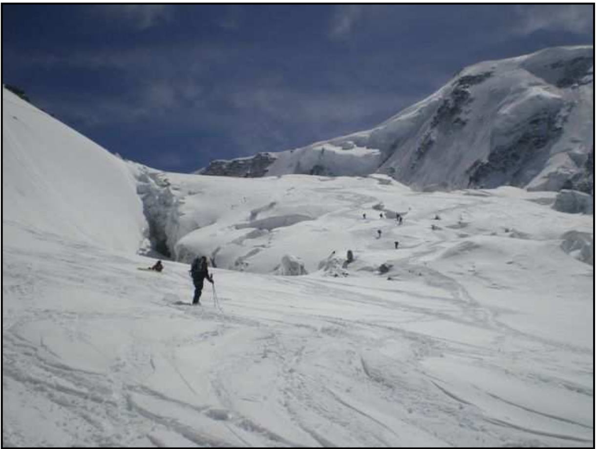
Remontée du Grenzletscher : un moment (à corde) tendu (e) !