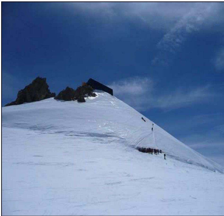
Encore un petit effort pour Margherita 4554 m C'est plus raide et glacé que ça en a l'air, tout ça dans un vent à 80 km/h