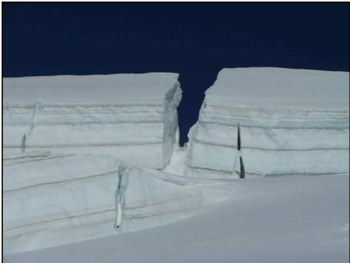
Montée à l'Alphubel – Qui a croqué le cake ??