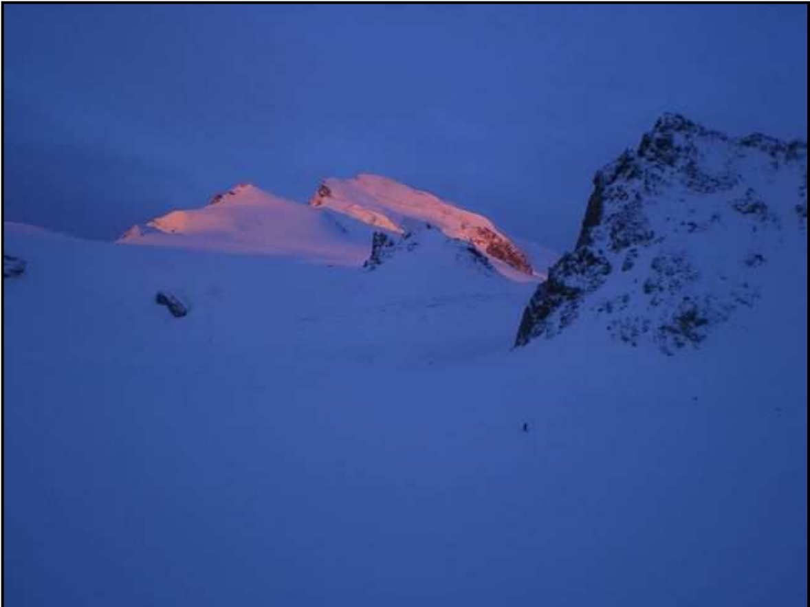
Montée à l'aube vers le Strahlhorn 4190m (monts des rayons de soleil)