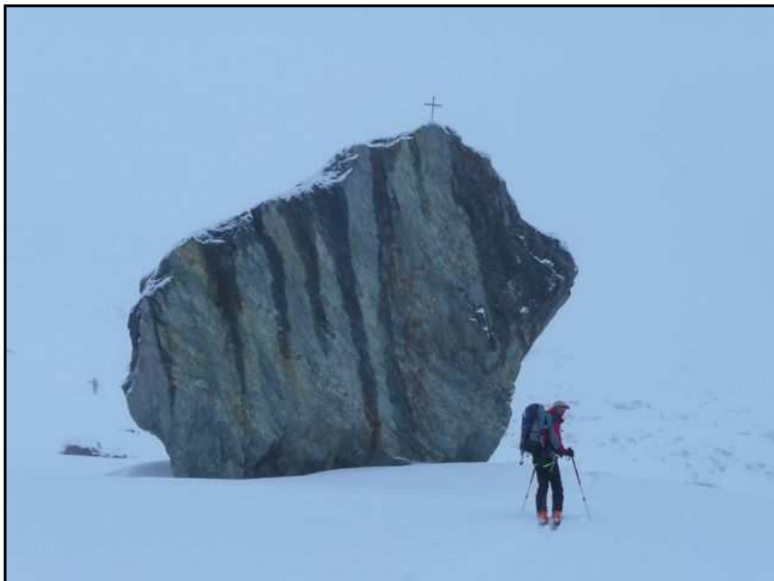
Départ de Täschhütte 2701m, dans le brouillard et 20 cm de fraîche Un bon repère, validé par le Très Haut