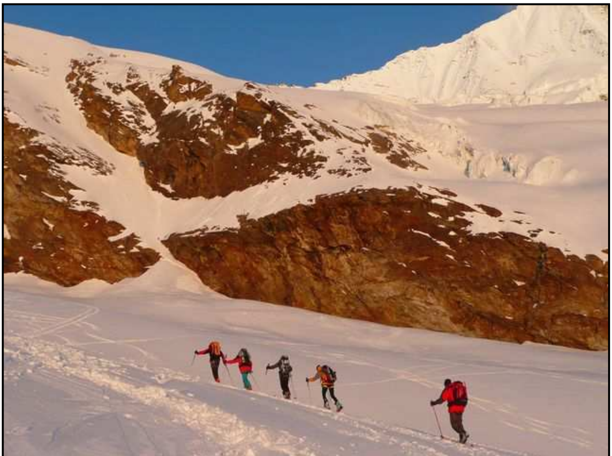
En route pour l'Alphubel 4206m - Vivienne est dans la course