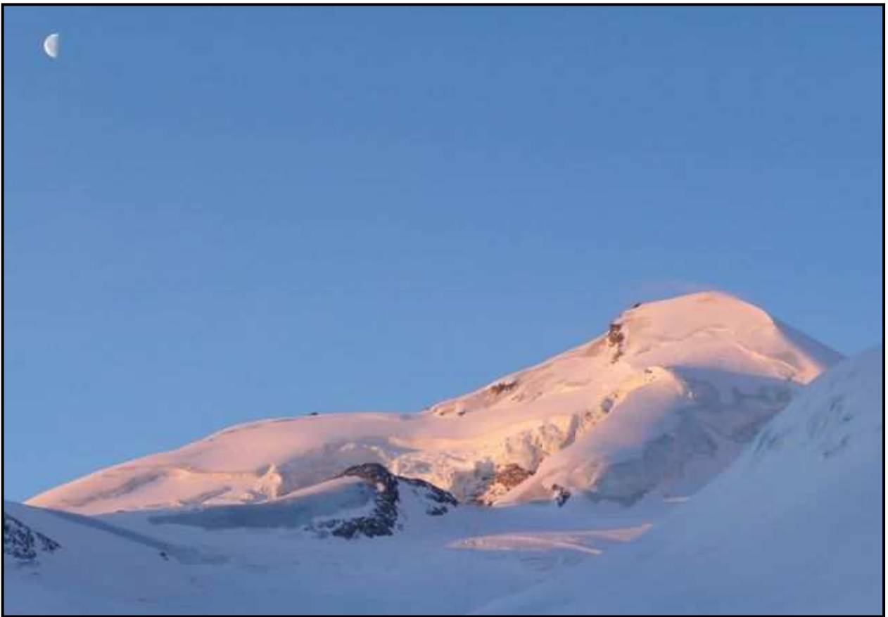
L'Allalinhorn moins austère au soleil levant, et à la lune