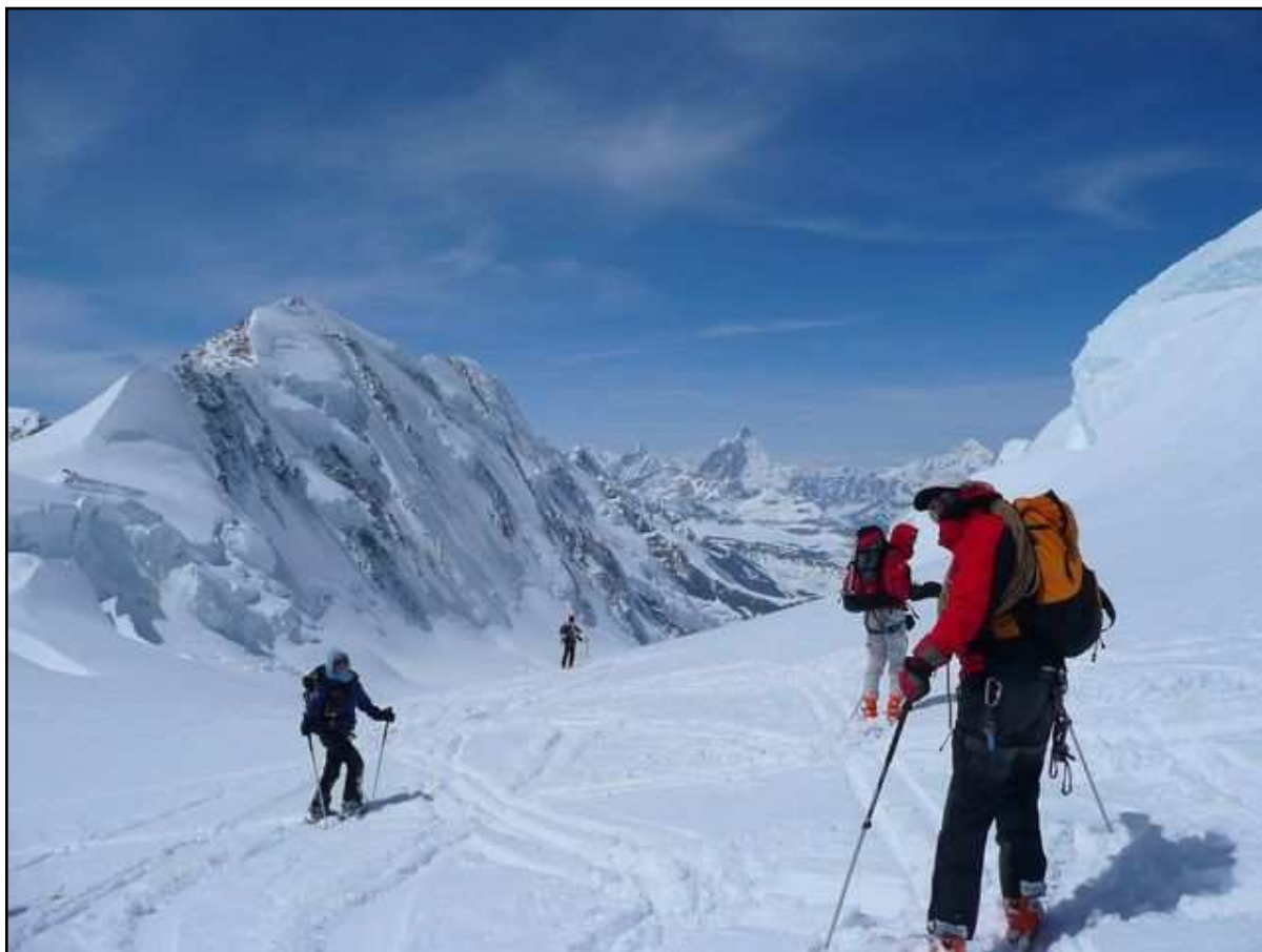
Descente en poudre à 4200m face au Liskamm et au Cervin