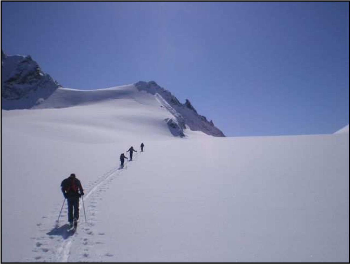
Ca se dégage ! : Montée à L'Allalypass 3564m, pour nous tous seuls