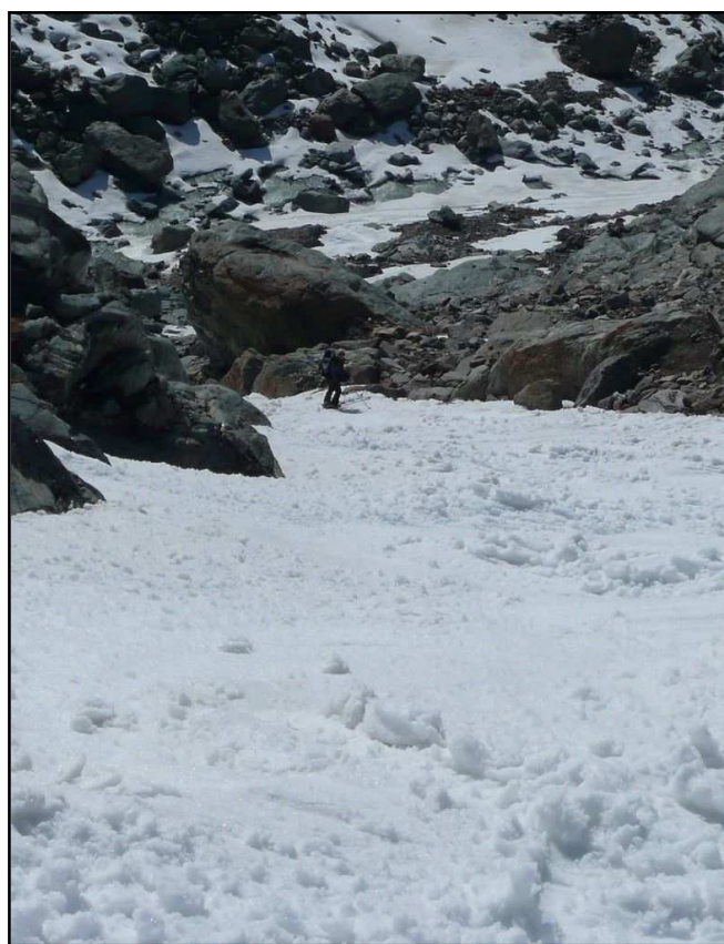
Le couloir raide et étroit qui évite la gorge : Tant qu'il en reste...même lourde, on prend