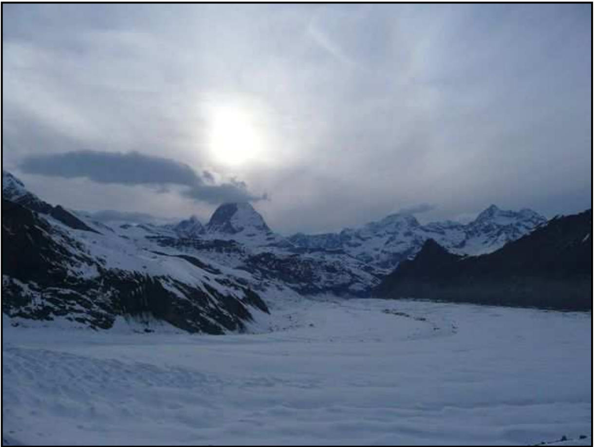
Vu de Monte Rosa Hütte : Le Cervin se fait mettre les points sur les « I »