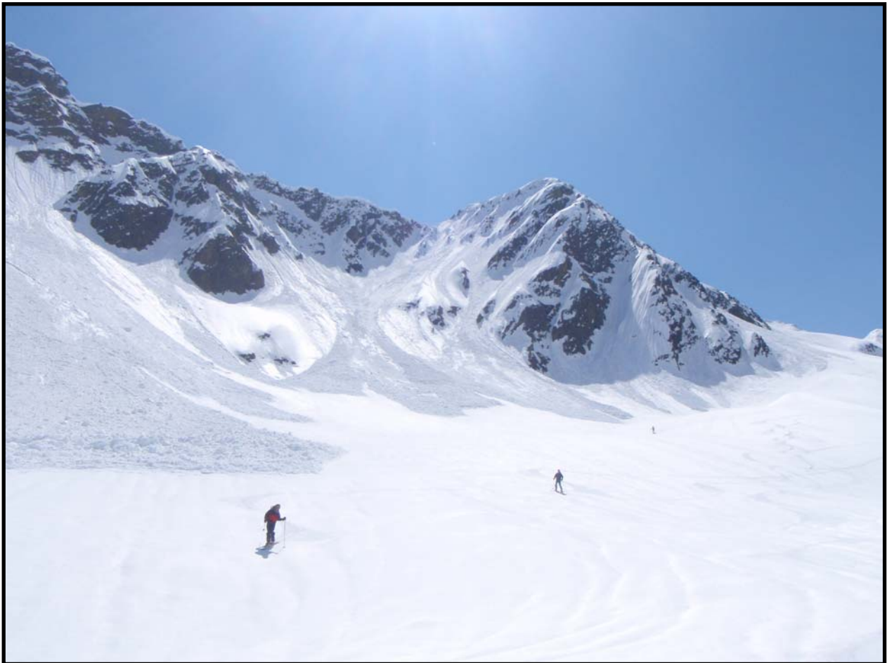
Descente sous le col de GUERCHA. Bonjour les coulées !