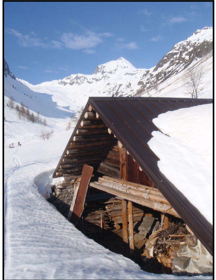
Le temps s'est arrêté à SAN BERNOLFO