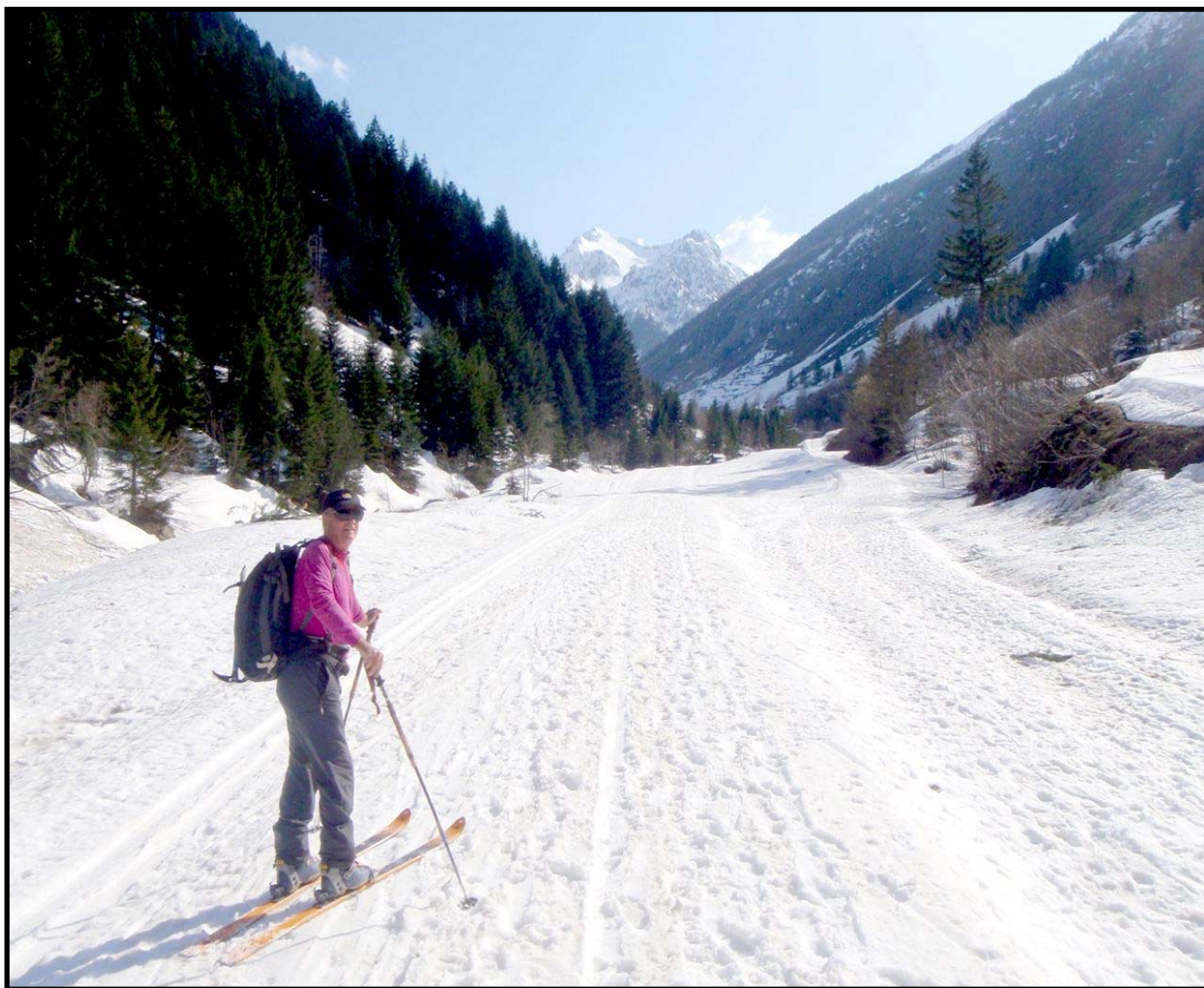
1 er Mai : Départ à 1300m pour le refuge ALEXANDRI