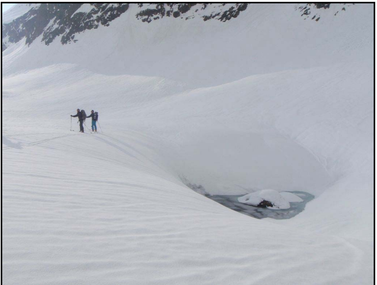
Lac Médian d'ISCHIATOR : 6 m de neige à 2400m !!