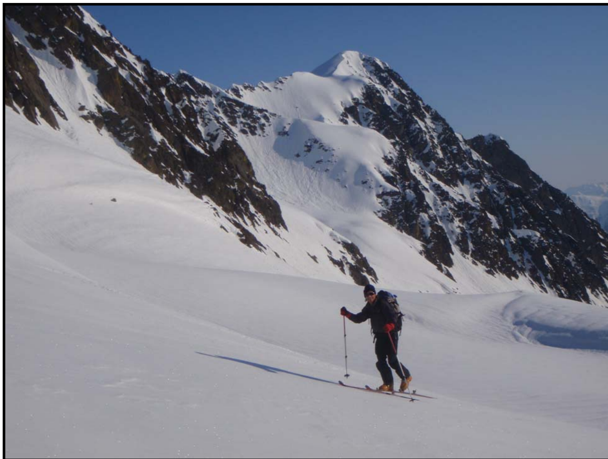
Philippe en pleine montée dans le vallon de COLLE LONGUE