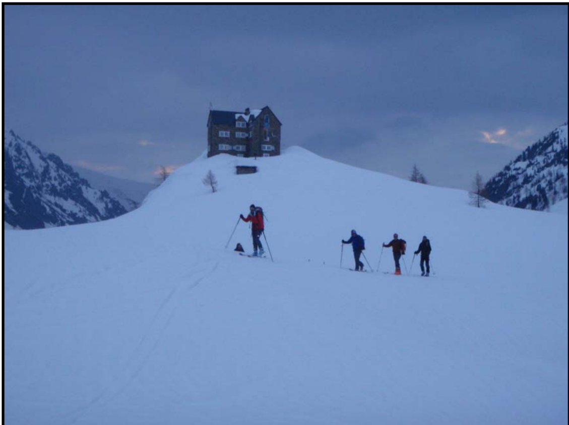
On quitte le château hanté sans conviction : ciel couvert, pas de regel

Avril 2008 : 1ère ouverture du refuge pour Oscar Mai 2009, la neige serait à hauteur de sa tête ! (Ref. Migliorero Montagnes Magazines – 02 / 2009)