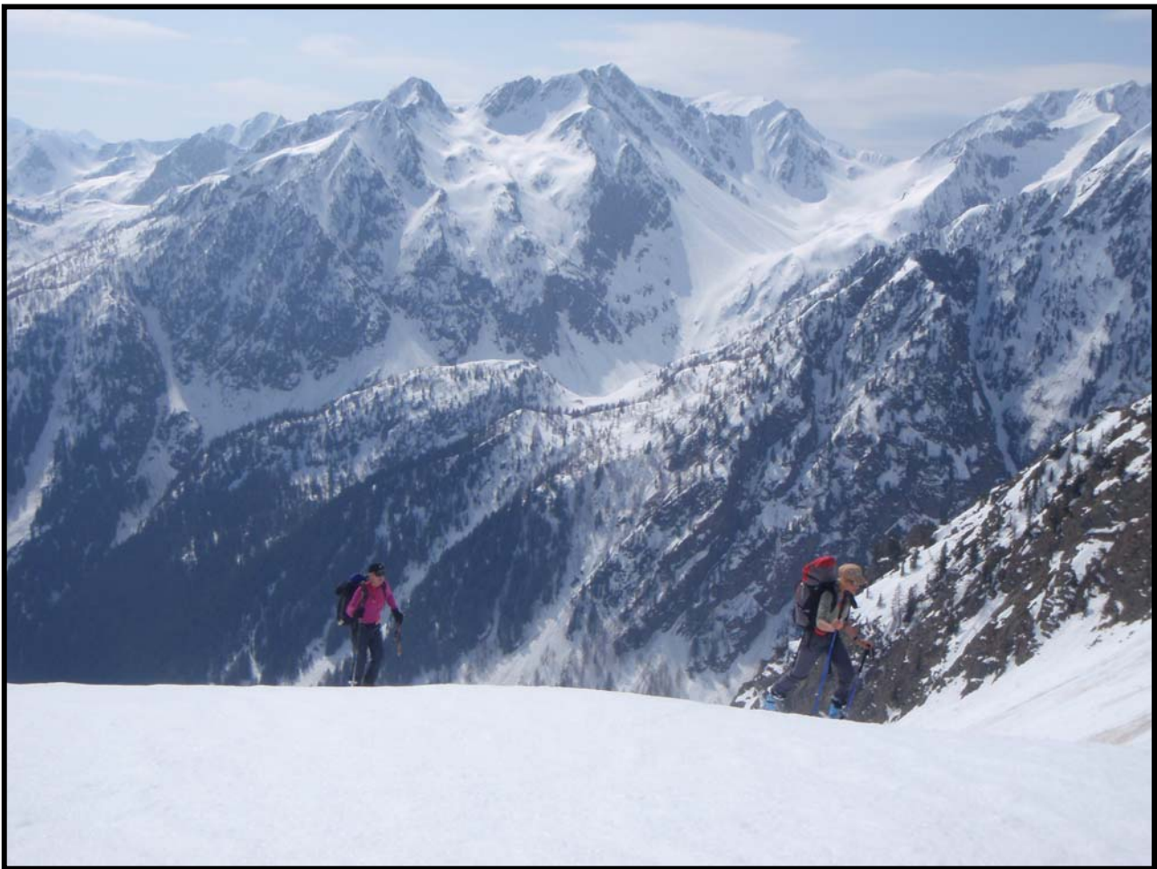
Remontée du Passo LAROUSSA (2453m) – Hier, c'était le vallon au fond