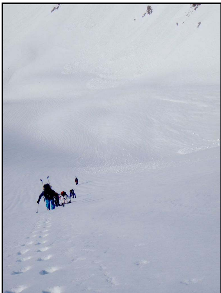
Remontée à 40° sous l'AUTARET