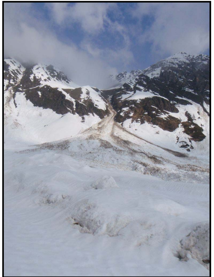
Avalanches à répétition sous le refuge MIGLIORERO