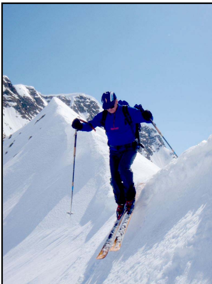
Elégant le Col de GUERCHA (2456m)