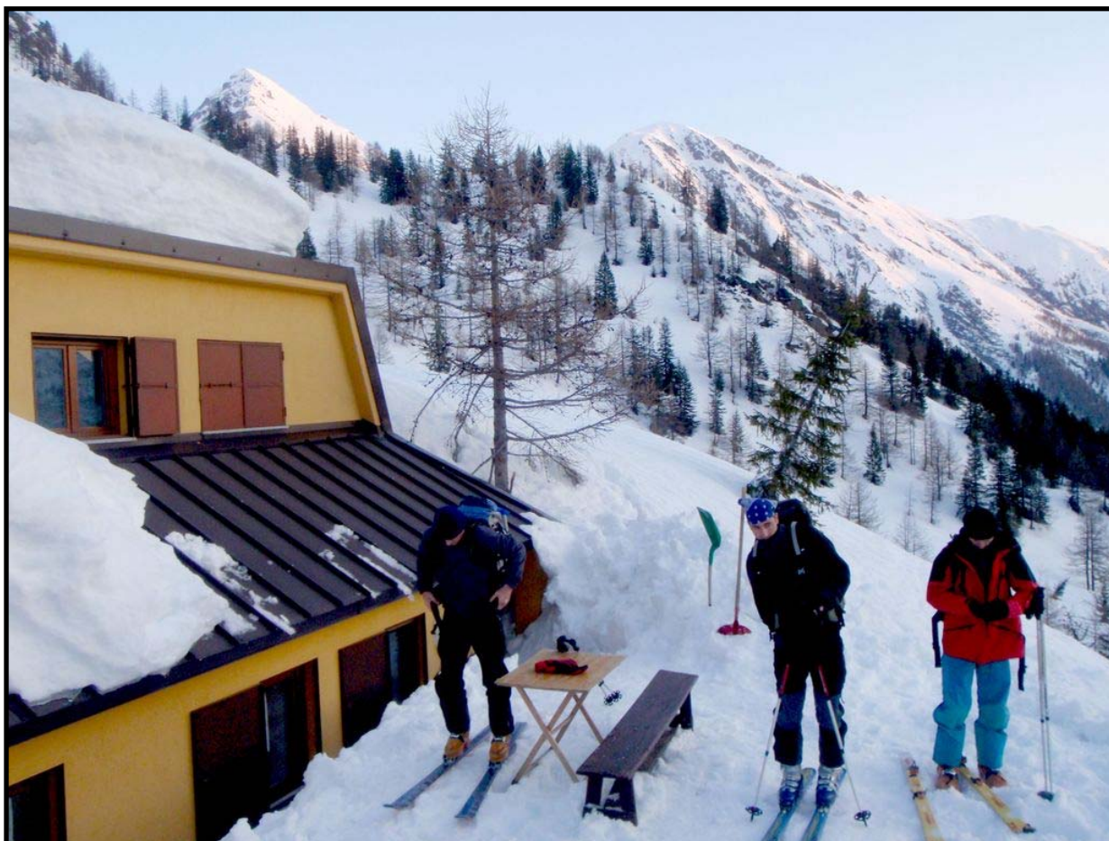
2 Mai : Refuge Alexandri : En route pour l'AUTARET