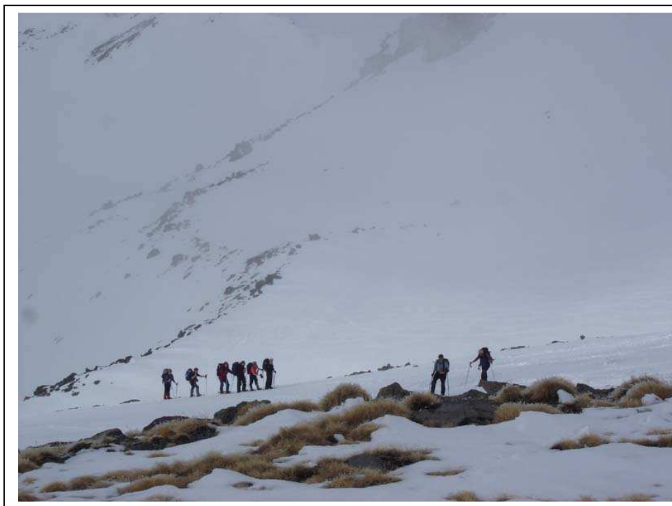
Le groupe arrive au col de la Gardiole à 2940 m

Nous passons le Lac de Laramon et nous obliquons vers la gauche en direction du Pic Blanc