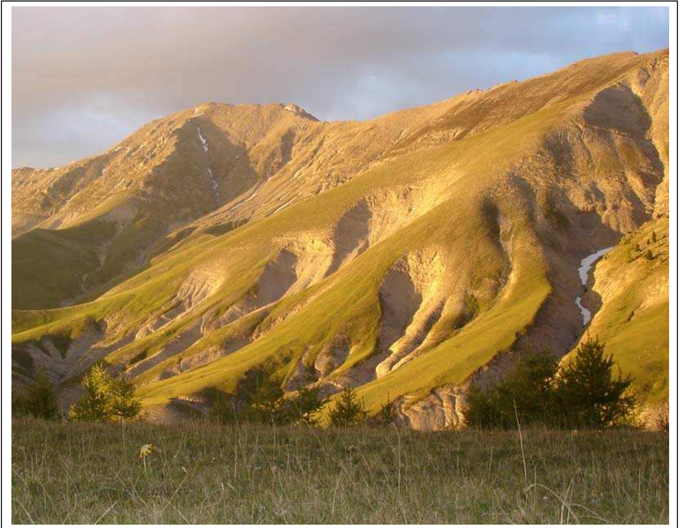
La douce lumière du soleil couchant irise la Montagne de Cadun