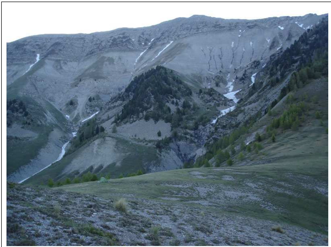
La tente semble minuscule sur le col du Mouréen dans la lumière de l'aube