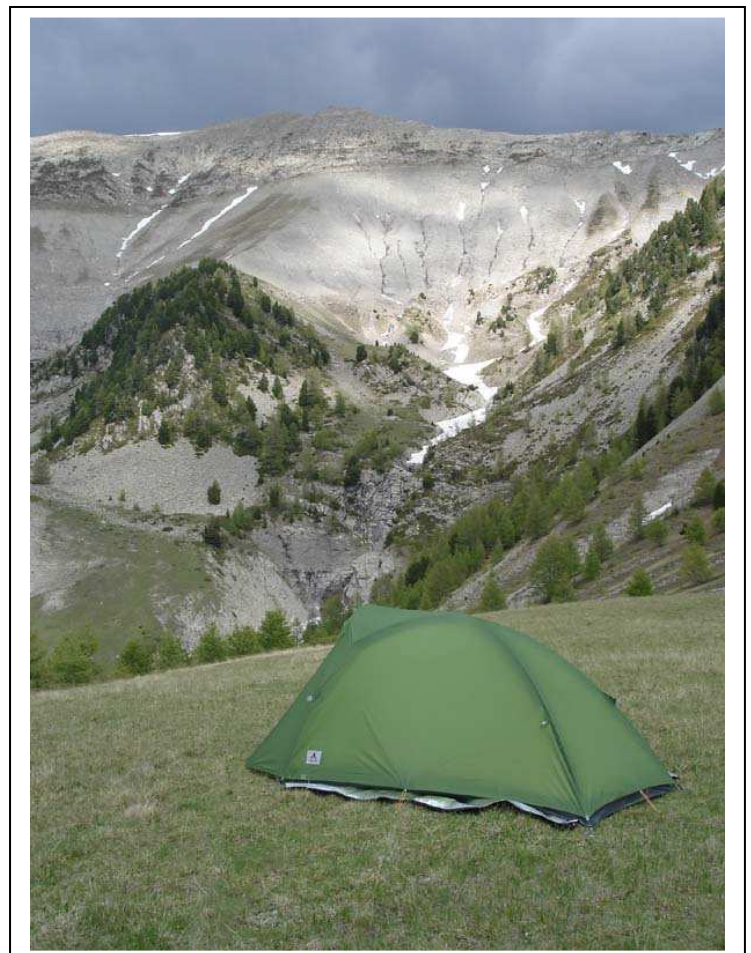
▼ La tente devant la crête du Caduc

Il nous reste un problème majeur, nous n'avons plus d'eau, il faut en trouver et remplir nos gourdes. La descente vers le vallon enneigé est longue et l'accès au ruisseau dans une faille du névé est périlleux.