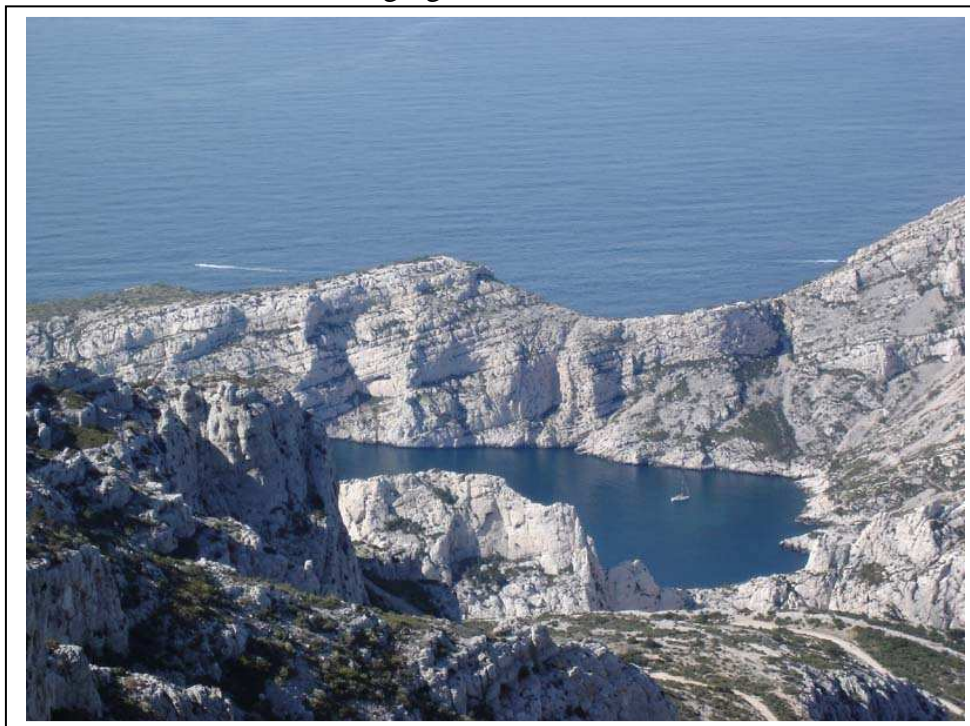
La Calanque de Morgiou depuis le col de la Candelle