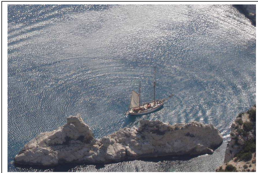
Un vieux gréement devant le torpilleur