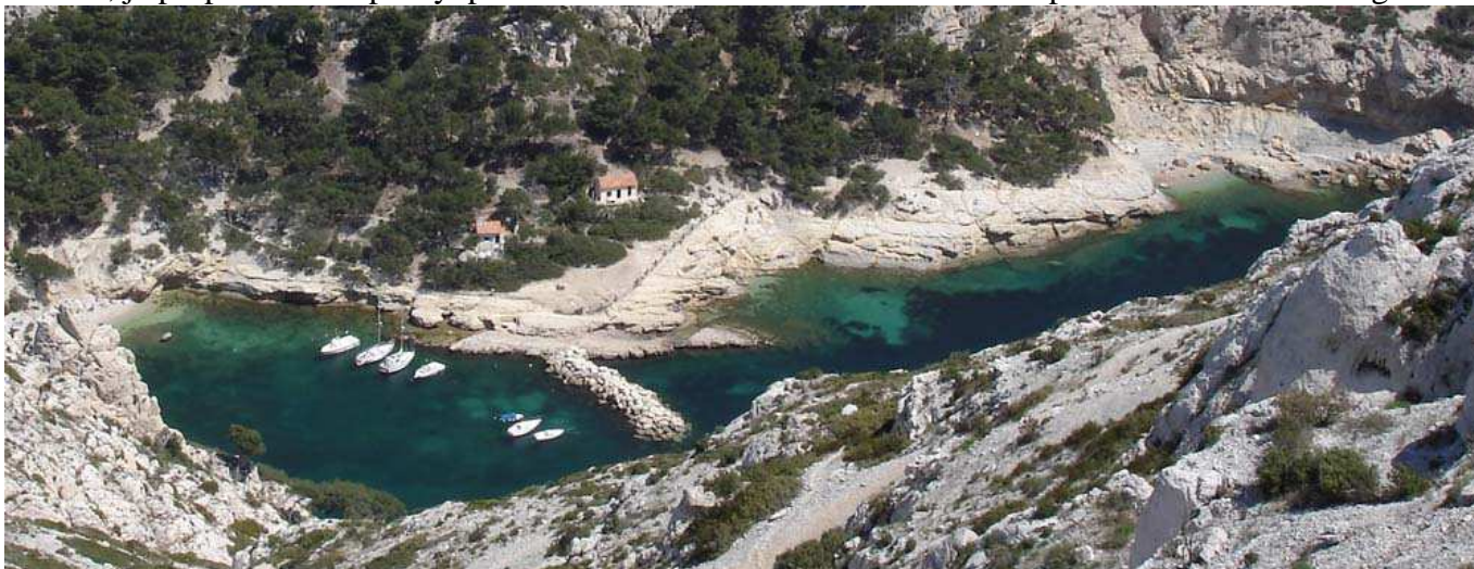
Le petit port de pêche de la Calanque de Morgiou pris de la crête de Sormiou