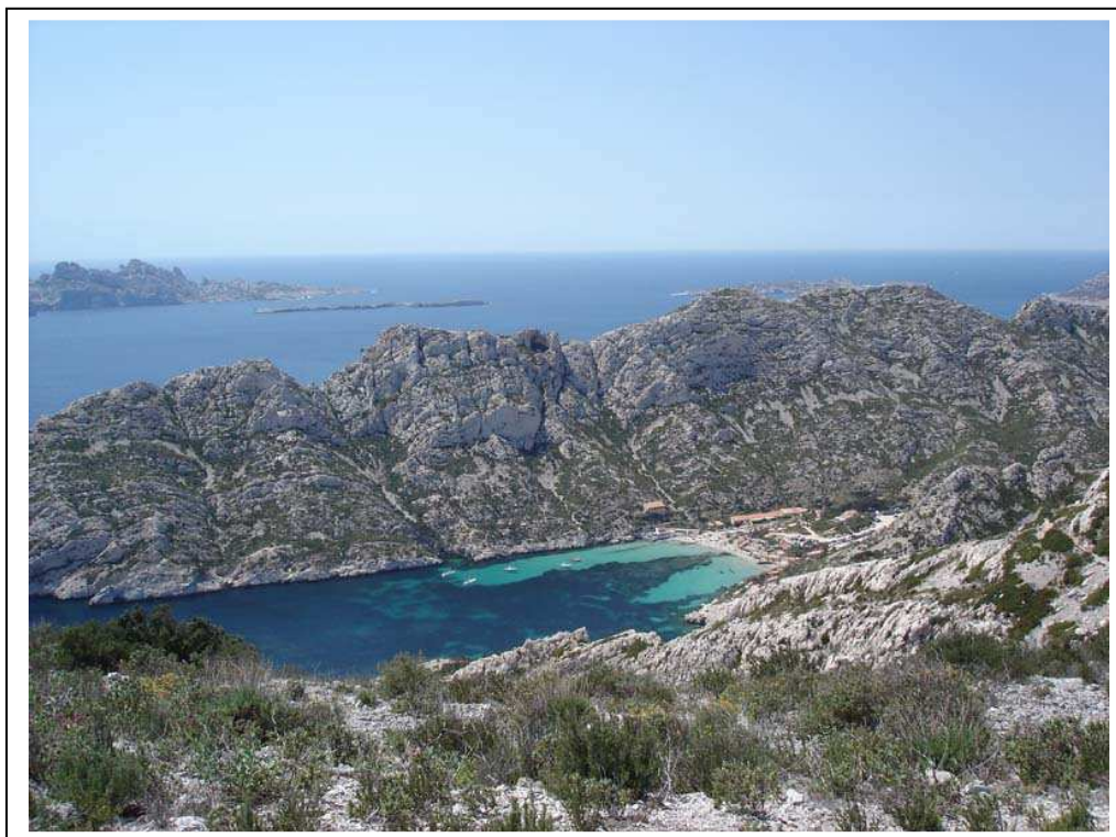
La Calanque de Sormiou avec son eau claire, digne des tropiques