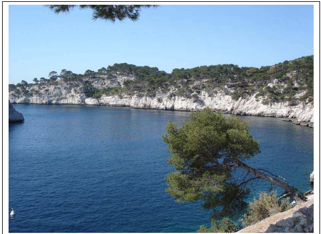
La première Calanque au départ de Cassis, celle de Port-Miou