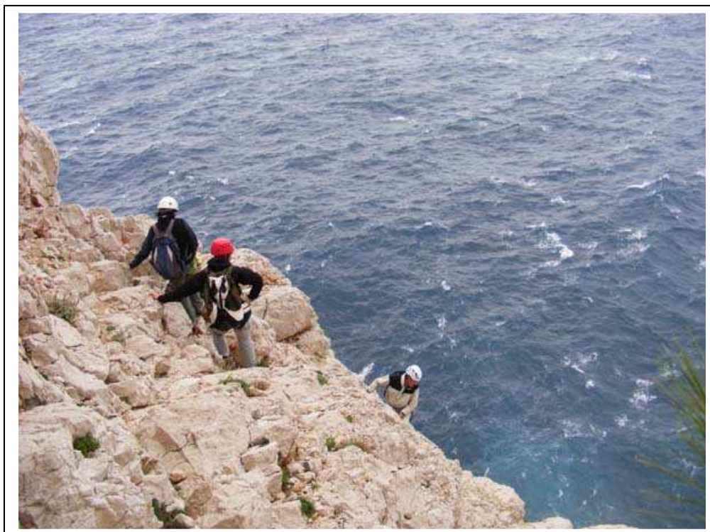
Début de la descente vers le bec face sud-ouest

Vers 9 heures, après distribution du matériel (casque, baudrier longe et descendeur), nous prenons le tracé noir vers le Bec de Sormiou.