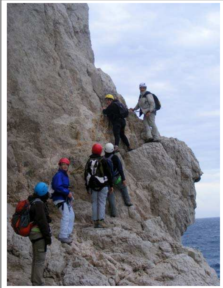
▲ Le début du passage de contournement du Bec